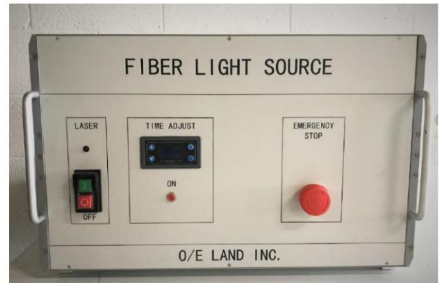
Module laser à fibre à impulsion UV